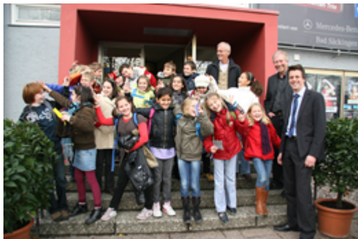
Foto Klasse 4b Weihermattenschule 2010/11